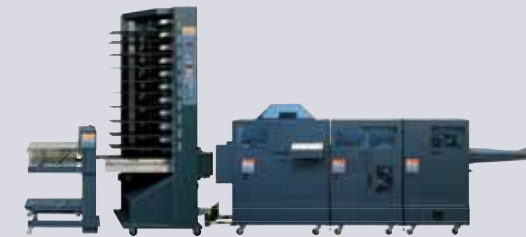
TD-d + LH Exit Kit + BST10-d main + SBM4