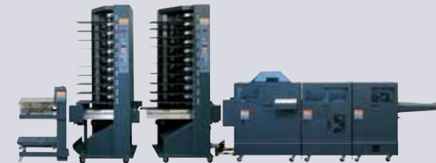
TD-d + BST10-d left + BST10-d main + SBM4